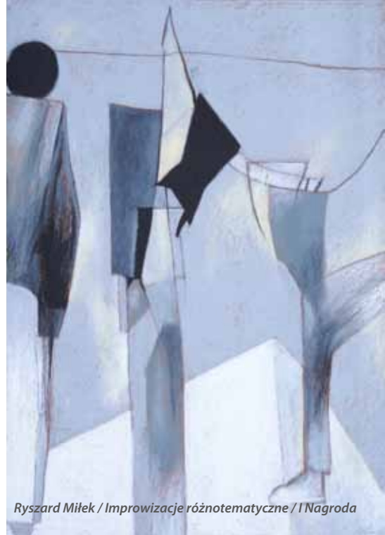
Ryszard Miłek / Improwizacje różnotematyczne / I Nagroda